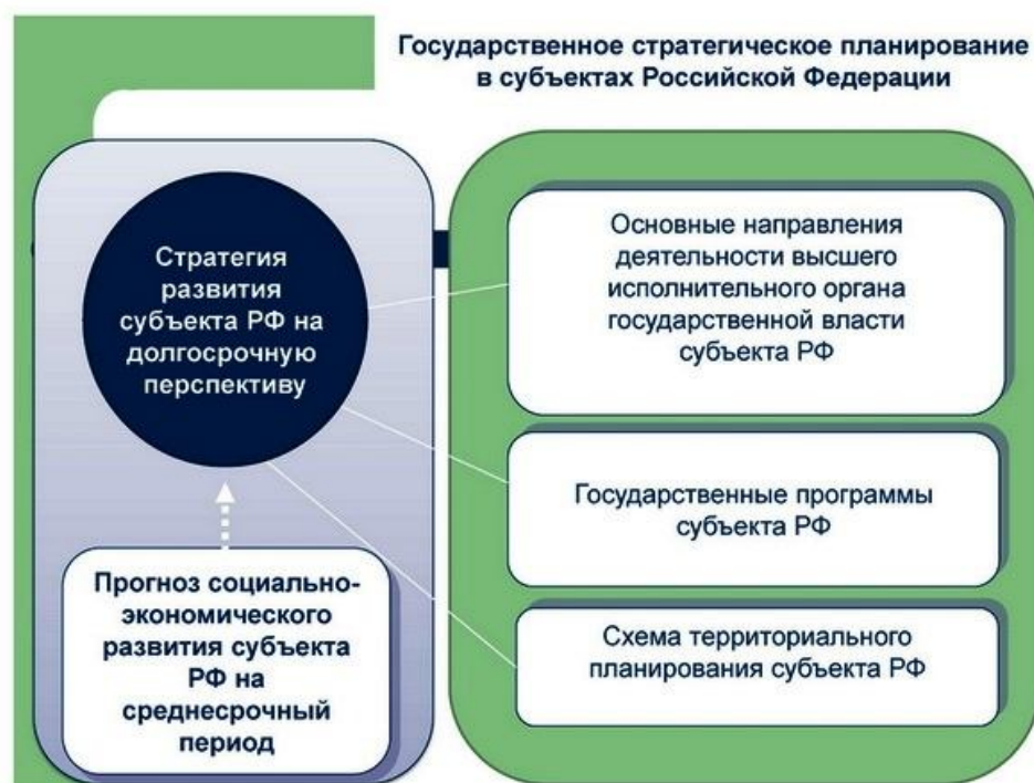
Рисунок - Государственное стратегическое планирование в субъектах РФ

Критерии оценивания результатов тестирования: