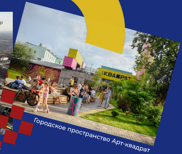
Городское пространство Арт-квадрат

«Арт-КВАДРАТ» расположен в прогулочной зоне исторической части Уфы. На территории городского центра «Арт-КВАДРАТ» долгие годы происходили важные для города события. Здесь работал чаеразвесочный заводик «Вогау и Ко», открылся первый в губернии кинотеатр, располагалась обувная фабрика.