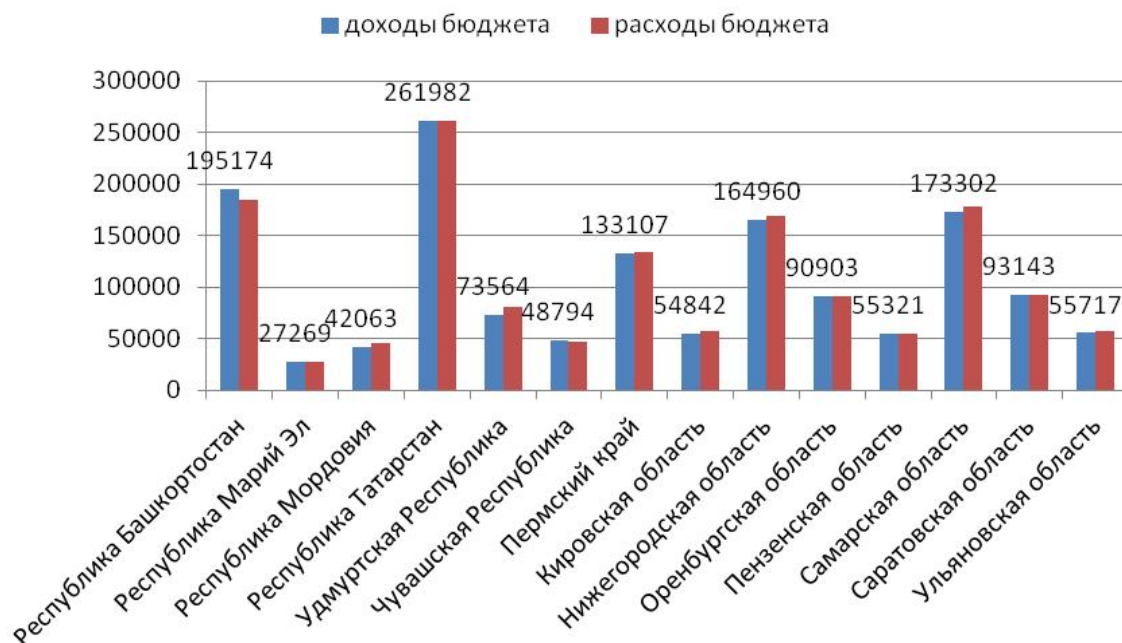
Рис. 1. Показатели исполнения бюджетов регионов ПФО за 2016 год, млрд руб.

налоговых доходов, поступающих в каждый уровень бюджетной системы и, наоборот, об объеме денежных средств бюджетов, расходовемых на территории самих регионов (рис. 1).